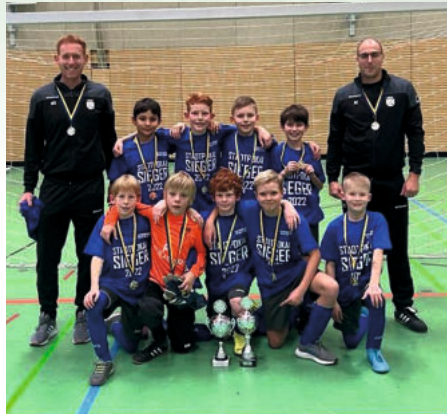
Stadtpokalsieg in Rottenburg

Mit etwa 35 Spieler*innen, vier Trainern und drei gemeldeten Mannschaften startete die E-Jugend in die Saison 2022/2023. Hierbei lag der Fokus nicht nur auf dem ‚Passen, Stoppen, Spielen‘, sondern auch darauf, alle Spieler auf ihrem jeweiligen Niveau mitzunehmen, Spaß am Training zu haben und sie in Wettbewerben zu fördern. Selbst bei Minusgraden und schneebedecktem Platz nahmen noch mehr als 20 Kinder am Training teil, was zweifellos auf einen motivierten und ehrgeizigen Jahrgang hinweist. Dies spiegelte sich auch in den sportlichen Erfolgen wider: Stadtpokalsieger in Rottenburg, Hallenturniersieger im Jahrgang 2013 in Ergenzingen, 1. Platz in der Qualistaffel 12 in der Hinrunde der SGM I, 2. Platz beim Solarcup und dritte Plätze bei Turnieren in Hochdorf und Weiler. Die sportliche Bilanz der E-Jugend war herausragend.