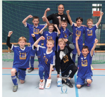
Turniersieg in Ergenzingen

Mit etwa 35 Spieler*innen, vier Trainern und drei gemeldeten Mannschaften startete die E-Jugend in die Saison 2022/2023. Hierbei lag der Fokus nicht nur auf dem ‚Passen, Stoppen, Spielen‘, sondern auch darauf, alle Spieler auf ihrem jeweiligen Niveau mitzunehmen, Spaß am Training zu haben und sie in Wettbewerben zu fördern. Selbst bei Minusgraden und schneebedecktem Platz nahmen noch mehr als 20 Kinder am Training teil, was zweifellos auf einen motivierten und ehrgeizigen Jahrgang hinweist. Dies spiegelte sich auch in den sportlichen Erfolgen wider: Stadtpokalsieger in Rottenburg, Hallenturniersieger im Jahrgang 2013 in Ergenzingen, 1. Platz in der Qualistaffel 12 in der Hinrunde der SGM I, 2. Platz beim Solarcup und dritte Plätze bei Turnieren in Hochdorf und Weiler. Die sportliche Bilanz der E-Jugend war herausragend.