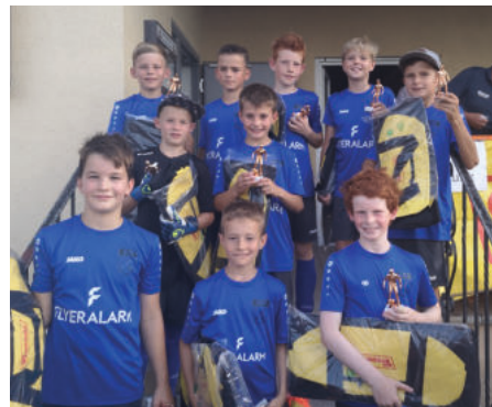
Fruccade-Cup in Weiler

Neben den regulären Spieltagen nahmen wir auch an weiteren Hallenturnieren in Tübingen, Gomaringen und Kirchentellinsfurt teil. Hallentrainingsspiele mit Ergenzingen und Derendingen, Turniere in Baisingen und Bühl sowie Einlagespiele an den Sporttagen in Kiebingen rundeten das umfangreiche Programm ab, sodass alle Spieler ihre Einsatzzeiten erhielten.