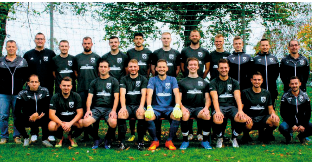
2. Mannschaft SGM TSV Kiebingen / SV Bühl

Liebe Fans, Mitglieder und Freunde des Vereins, nach einer langen Durststrecke in der B-Liga haben wir es endlich geschafft, als Meister wieder in die A-Liga zurückzukehren, mit 6 Punkten Vorsprung und einem Torverhältnis von +97 sehr souverän. Mit großer Freude und Stolz blicke ich auf die vergangene Saison 22/23 zurück. Es war eine aufregende Reise, in der unser Team unglaubliche Leistungen erbracht hat. Der Start in die Saison war geprägt von Aufregung und Vorfreude auf die A-Liga.