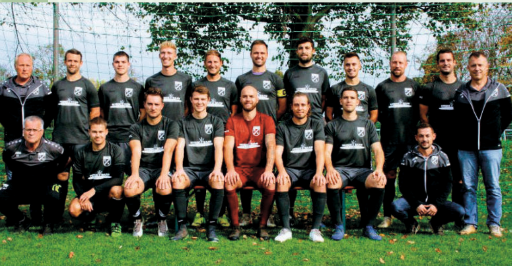
1. Mannschaft SGM TSV Kiebingen / SV Bühl